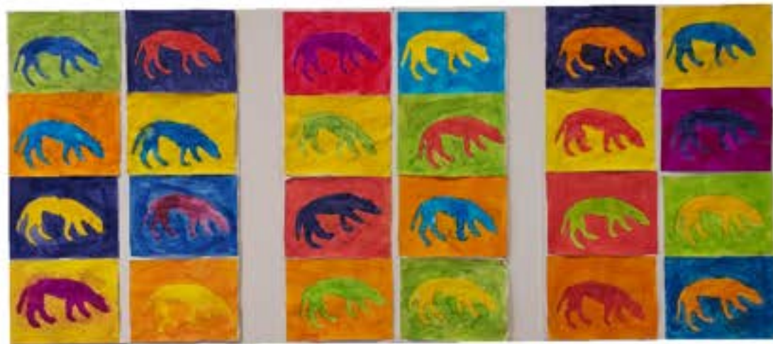
Le chien rouge – Paul Gauguin