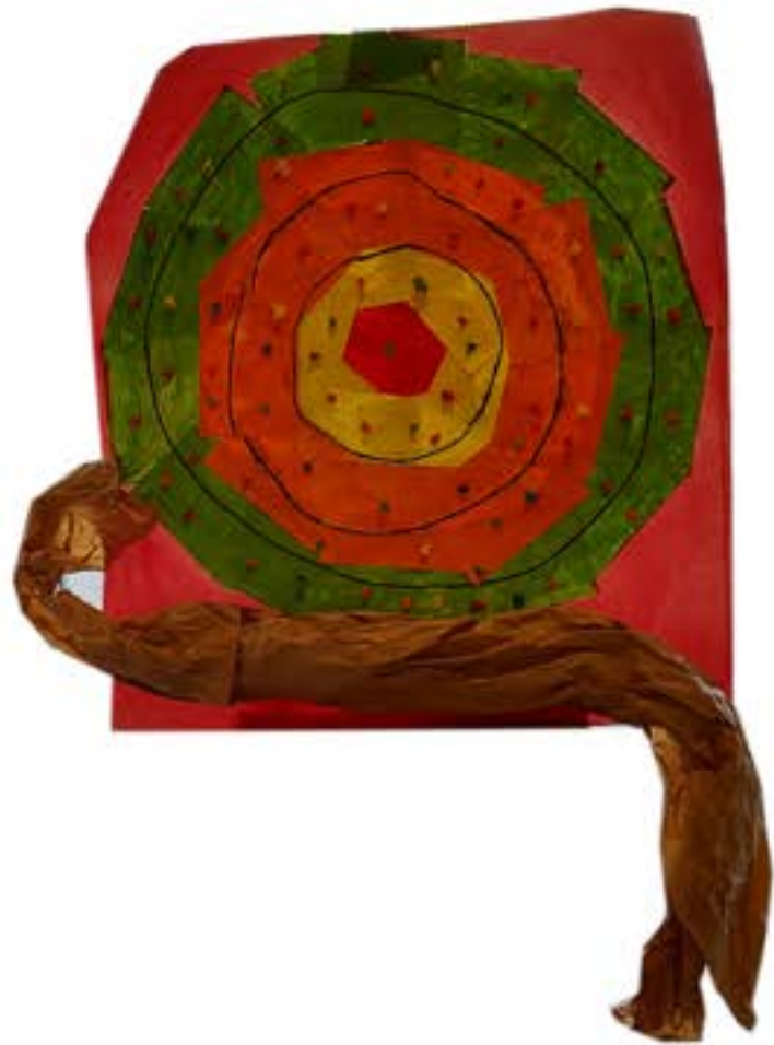
Jeweled trees – Natasha Wescoat